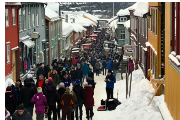
Trångt på Kjerkgata under marknadsdagarna.