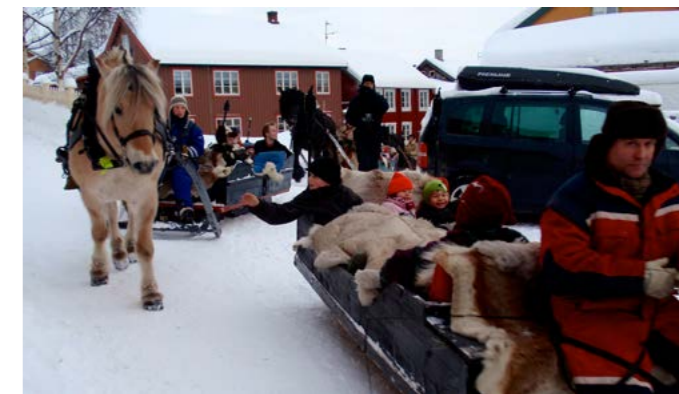
I år besöktes vintermarknaden av ett åttiotal hästforor från båda sidor riksgränsen.