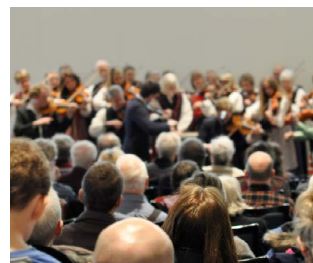
Närmare 250 personer kom till ASI spelmanslags jubileumskonserter på Winterfest 2016