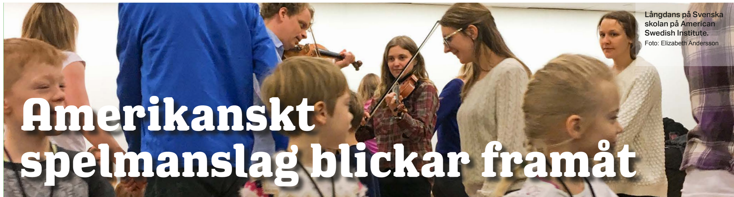
Långdans på Svenska skolan på American Swedish Institute.