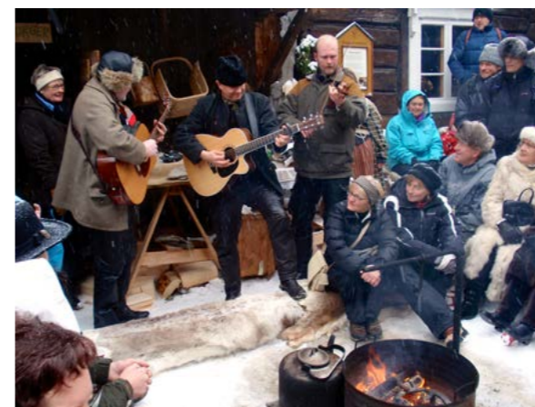
Musik i snöglopp på Langknutgården