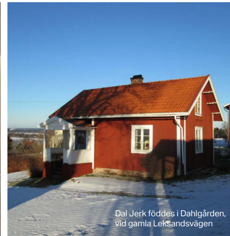
Dal Jerk föddes i Dahlgården, vid gamla Leksandsvägen

tog efter, eftersom spelet blev så medryckande. Han använde sig även av ett spelsätt, som han kallade – kontra, som bestod i en stråkföring närmast liknande rullstråken från finnmarken.