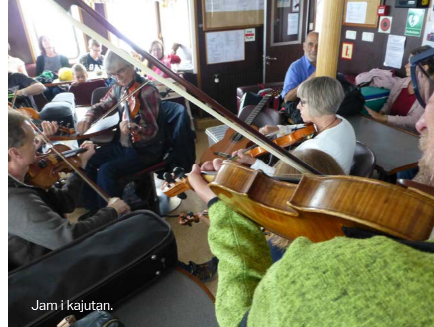
Jam i kajutan.