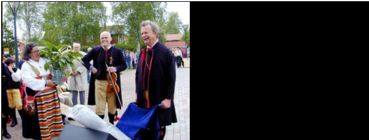
Från invigningen av Folkmusikens hus 2000.

Projektet godkändes och år 2000 invigdes Folkmusikens hus. EU-projektet var satt på tre år, men förlängdes i en andra fas från och med 2001.