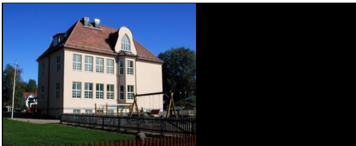
Folkmusikens hus är inhytt i gamla Kyrkskolan i Rättvik.

Det var idéer som legat och grott i spelmansrörelsen i länet, att det vore bra om folkmusiken manifesterades publikt, att göra musiken synlig och ge den en röst. En egen röst, snarare än den schablonbild som ofta presenterades i turistbroschyrer och av besöksnäringen.